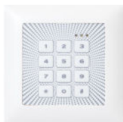
EVIS EDI Pin